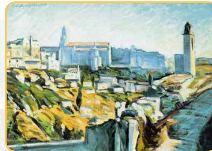
Paesaggio di Gravina - 30x40 olio su cartone telato Mario Gramegna